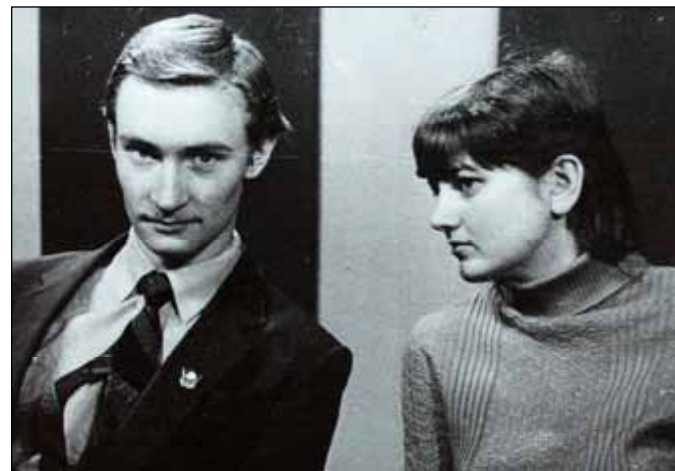
№ 76. Студенты