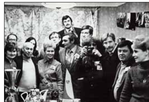
№ 79. Студенты