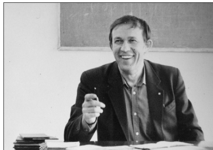
№ 77. На лекции