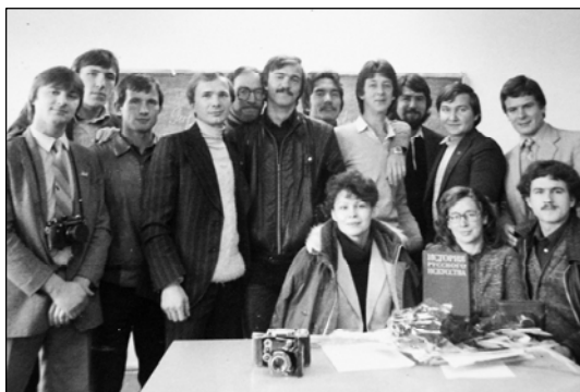
№ 78. Студенты