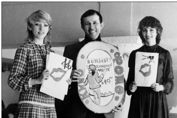
№ 74. На перемене