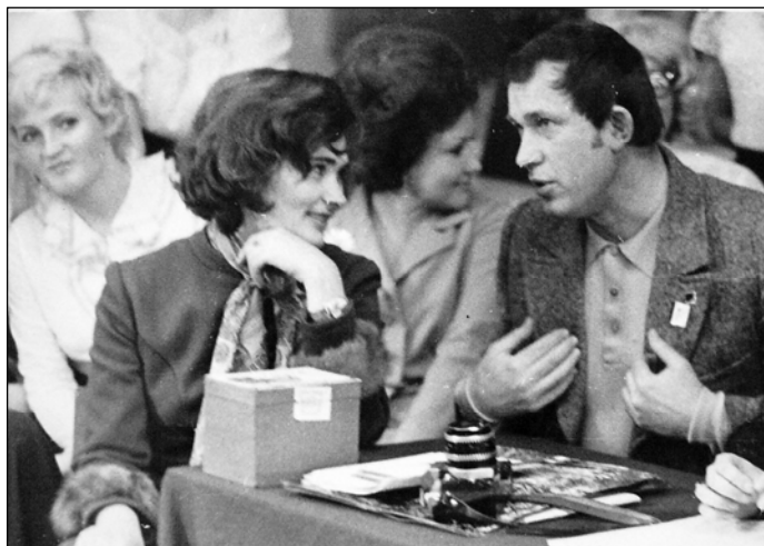
№ 71. Студенты