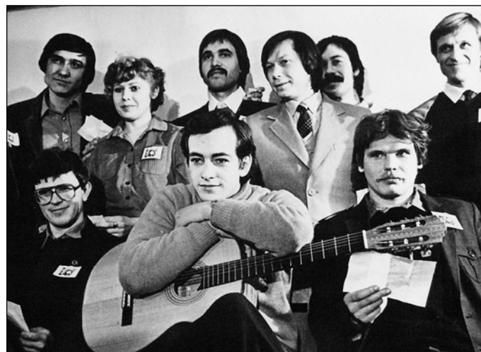
№ 72. После лекции