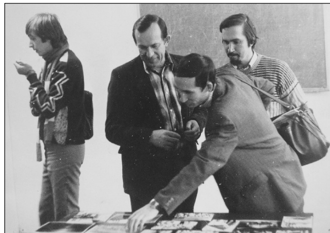
№ 73. Студенты